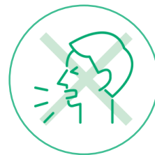
感染状況のモニタリング

東急ベルは、お客様に安心してサービスをご利用いただけるよう、以下の感染予防対策を実施しています。