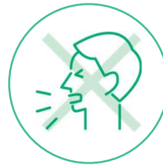
体調不良時の出社取りやめ