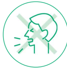
体調不良時の出社取りやめ